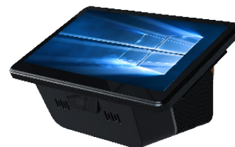
SCANNER 2D EN FAÇADE