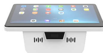
STILL BLANC = OS ANDROID